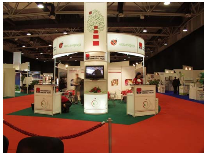
ECO EXPO 2011 | 6/4/2011